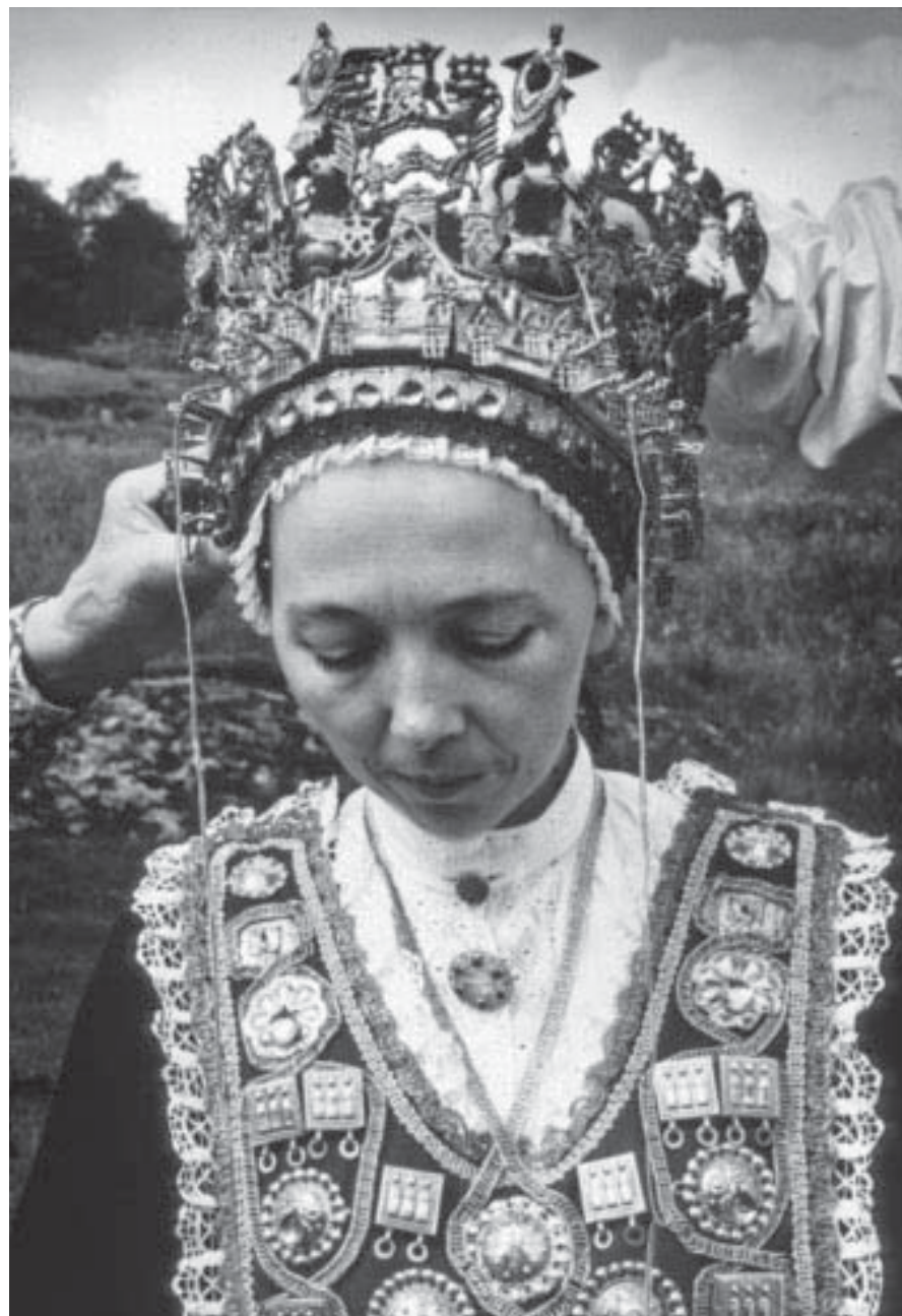
Brur. Fana. Krona er sett nedpå onnesylveret og skal bindast på. (Noss reg. og foto Fana ca. 1960.)