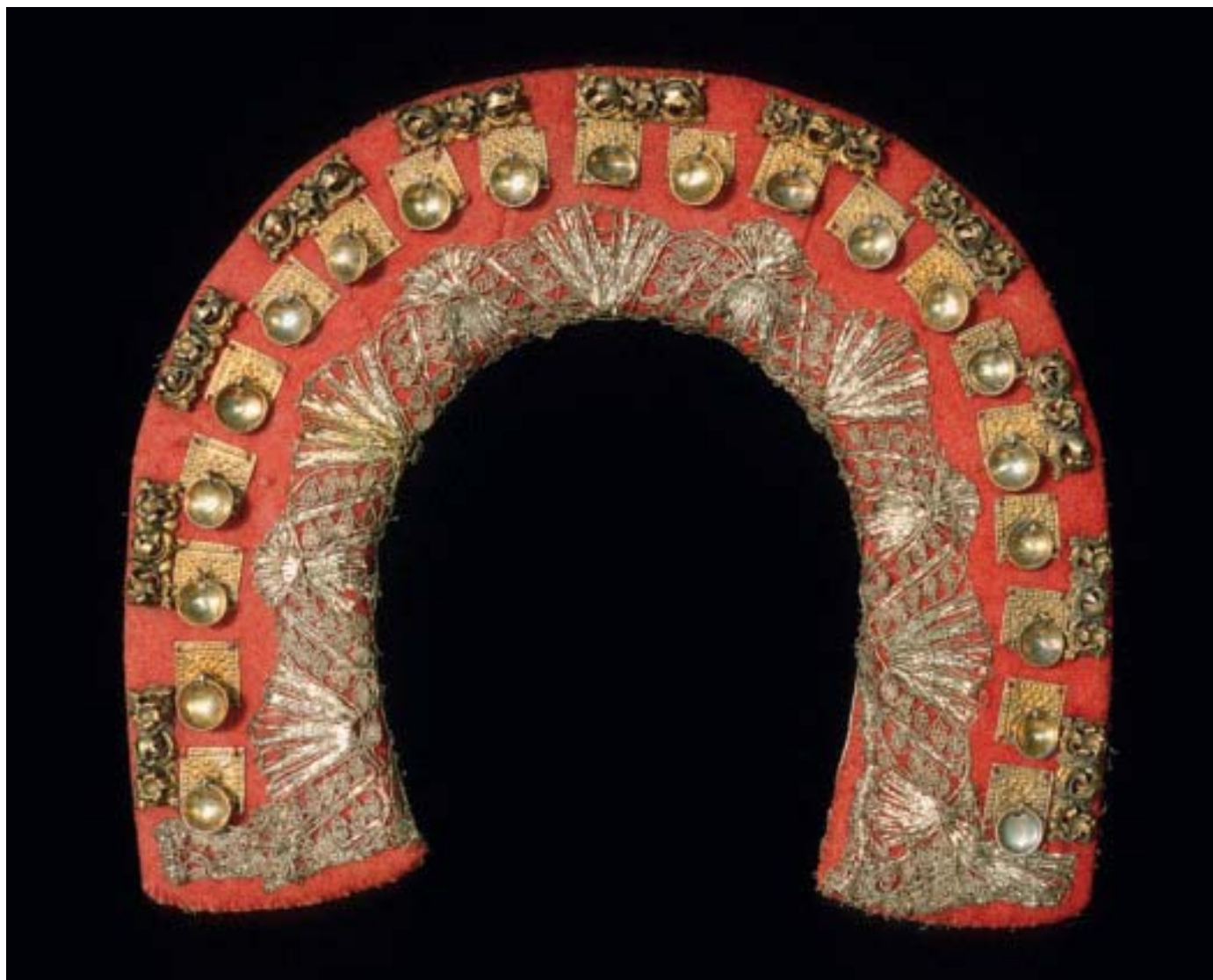
Bona, Vinje. "Brugtes af Piger, kaldtes Bonad." Jenterudd trekt med raudt ullty. Framsida er påsett ei rad gotiske maler, 11 i alt, ei rad forgylte plater med pressa ornament og eitt skållauv i kvar, 20 i alt. Langs innerkanten er ein sølvknipling. Baksida er prydd med ein sølv- og ein gullknipling. (NF 1680-15. Er innkomme til Etnografisk museum i 1850.)