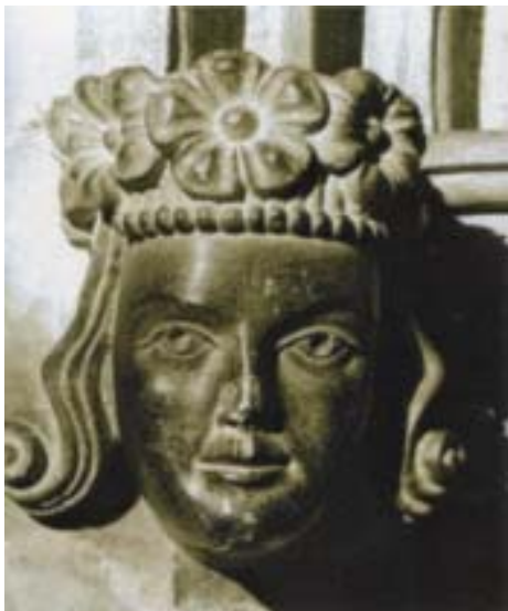
Truleg Håkon V Magnusson (1270–1319), Stavanger Domkirke.

Ordet lad går attende til gamalnorsk hlað (m.sg.) laga til verbet hlaða, som tyder å leggje noko i ein viss orden anten ved sida av eller oppå einannan så tett at botnen er gøymd. Lad er til dømes eit rektangulært avstiva stykkje ty, så tett sett med prydnader at botnen er gøymd. Ladet vart bunde om hovudet.