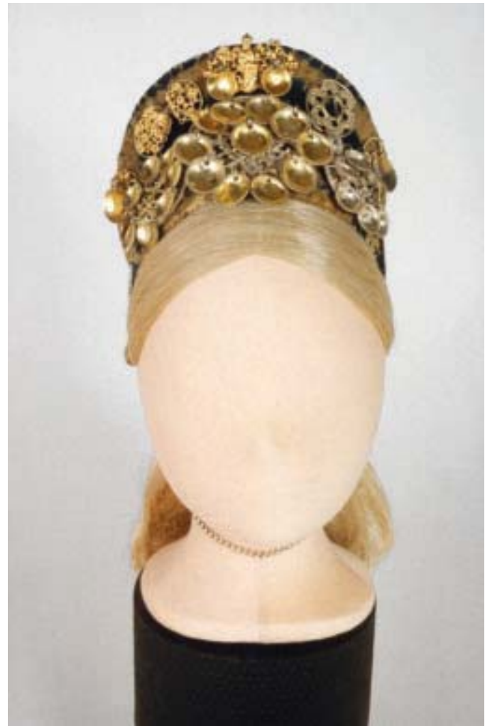
Utmannlad, Bygland. Rudden er trekt med raudt ullty og påsett maler. (NF 1936-0223.)