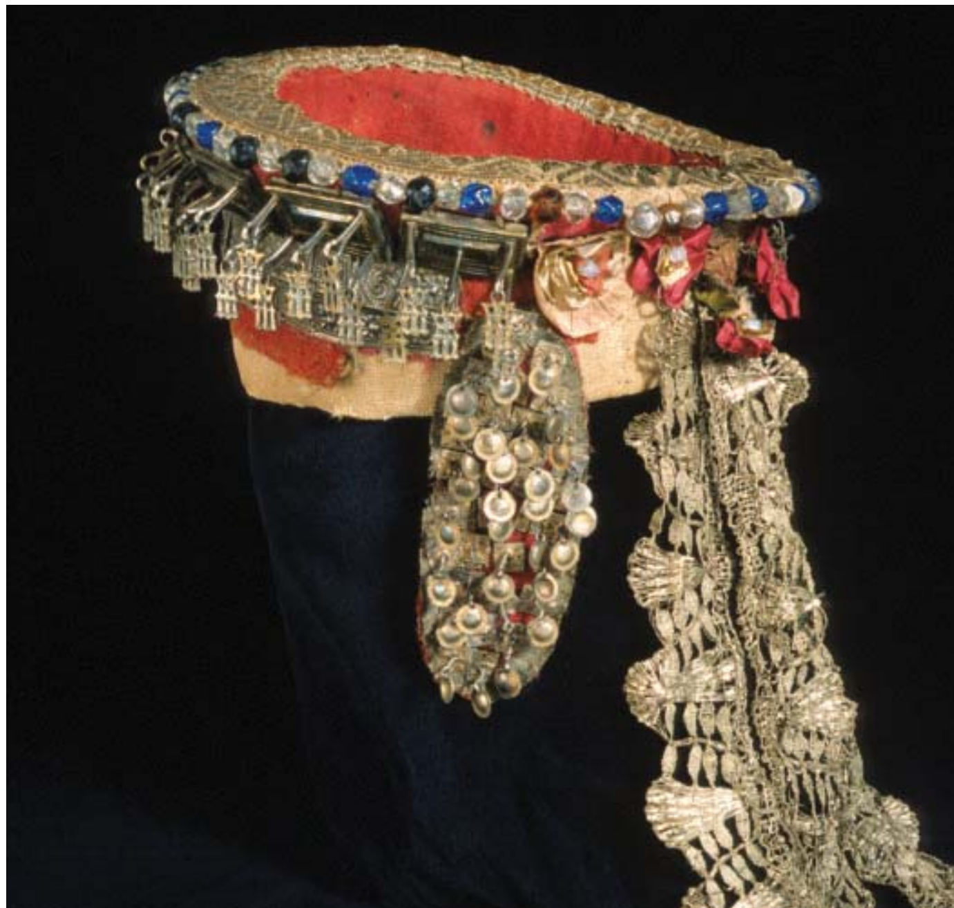
Brurerull, Vang i Valdres. Hjulet på valken er påsett ei sølvblonde og ei rad store blå og blanke glasperler langs ytterkanten. Støler i tre rader er festa til rullen bak. Nakken er open. (NF 1648-14.)