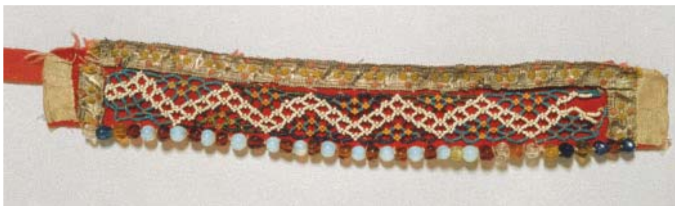
Jentebore, Vik. Trædd fleirfarga perlemønster, sikksakkborder og trekantar festa til raudt ullty. Store farga glasperler etter bakkanten. Sølvblonde etter framkanten. (DHS 6490, jamfør korilstein-hårlag Ål eller Hol.)