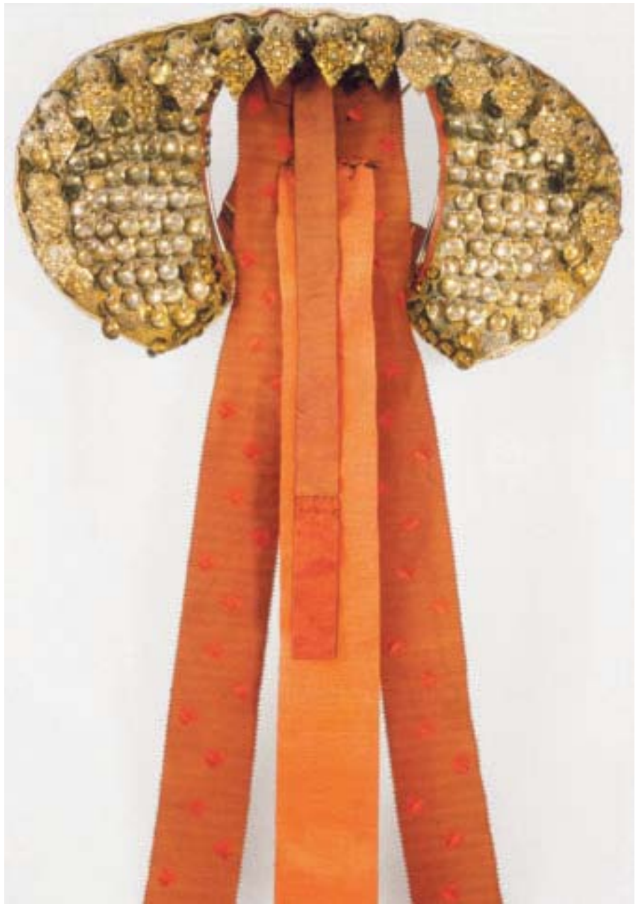
Lad, Fyresdal. Framsida er tett sett med små firkanta forgylte støler med eit skållauv i kvar. Ei rad kulemaler med rombelauv sit langs kanten. Silkeband skal henge ned bak over det utslåtte håret. (NF 1898-828.)