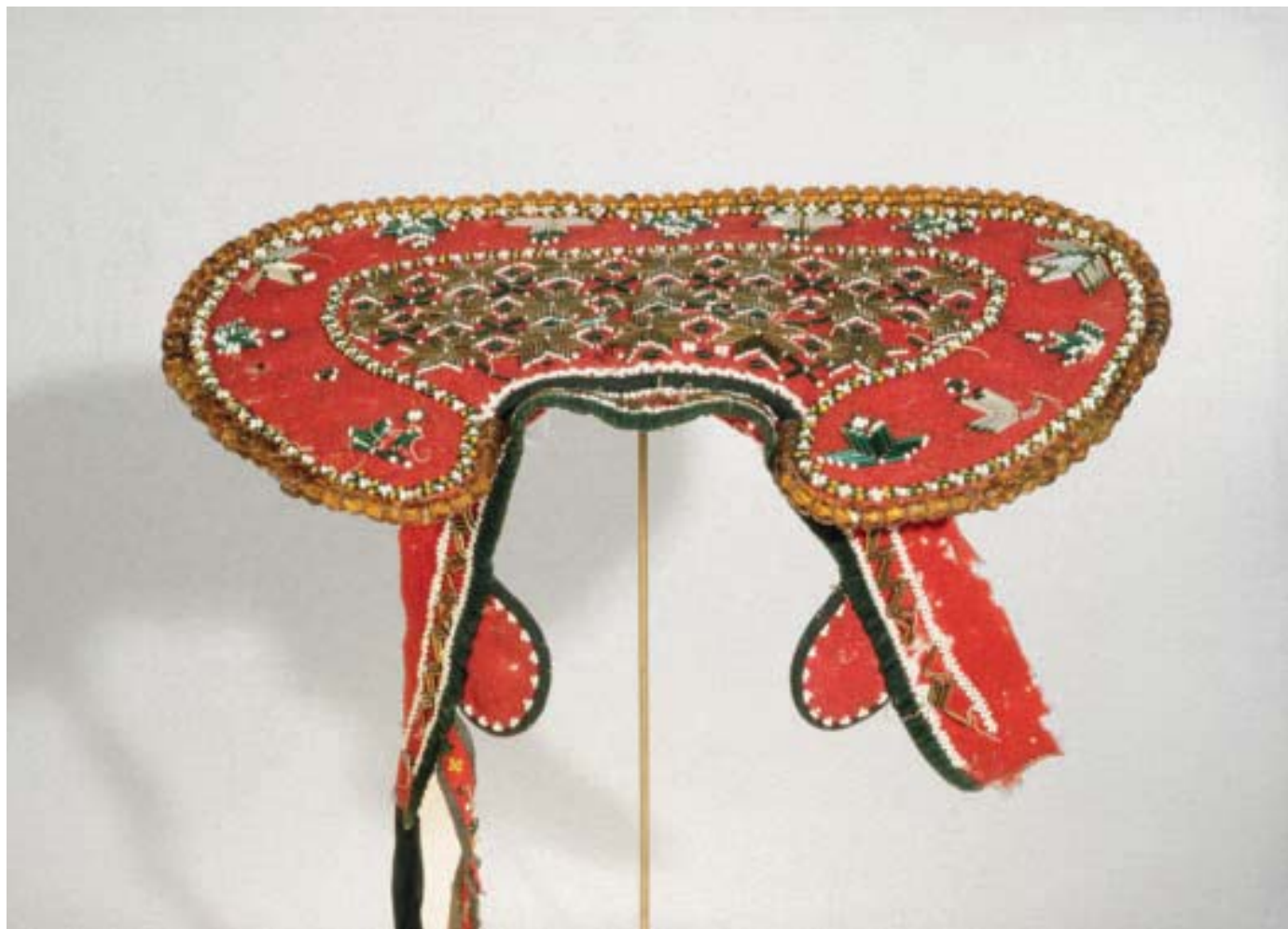
Brurekrone, Voss. Valk med perleprydnader. Stuttsidene er påhengde hjarteforma spenner med filigransroser og skållauv. (NM 15.454.)