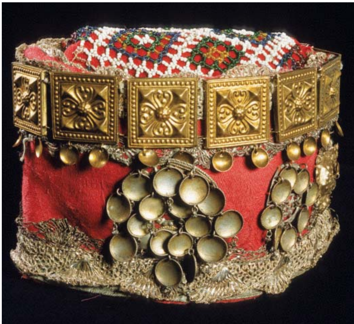
Krone, Nes i Hallingdal. Raud ulldamask. Etter nedre- og øvrekanten sit ein metallknipling. Trosken er påsett søljer, og borespenne, og langs øvrekanten er ei rad støler. Pullen er ein korilsteinbrystklut. (HFN nr. 3138.)