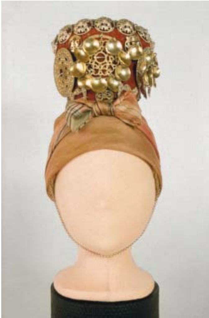
Vrinslad. Valken, ladvrinsen er avstiva, trekt med raudt ullty og påsett ei rad maler etter øvrekanten og søljer.