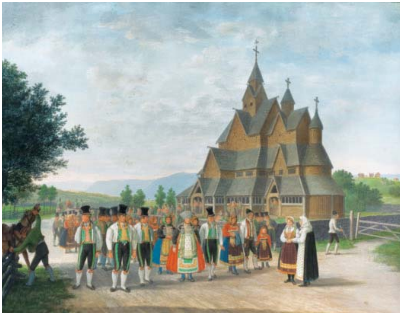
Brurefylgje ved Heddal stavkyrkje. Brura med hovudsølvet står i midten, brudgommen med brudgomsdalar lengst til venstre. Johannes Flintoe. Gouache. Det kgl. Slott, Oslo.