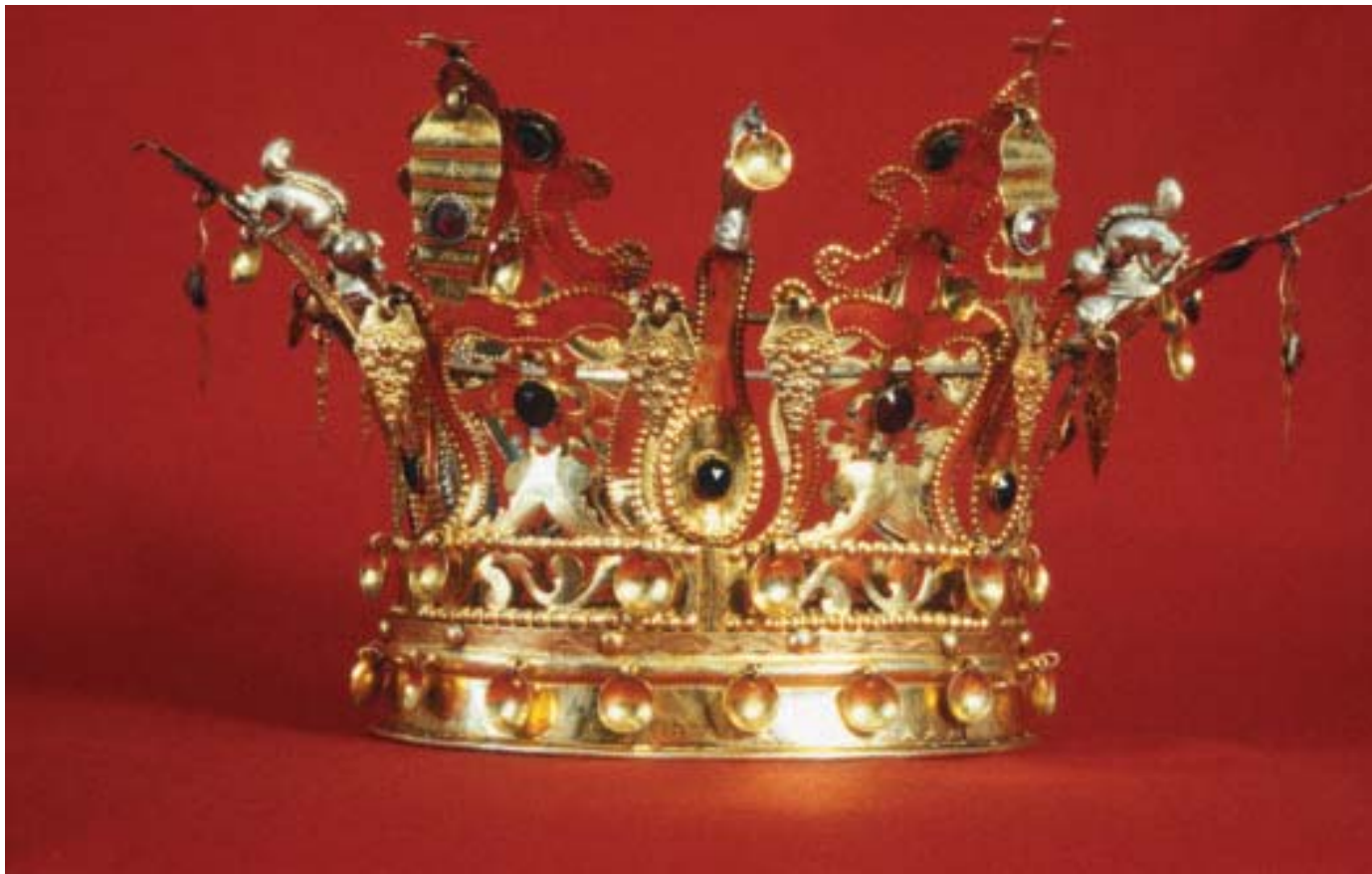
Brurekrone, Osterøy. Datert 1848