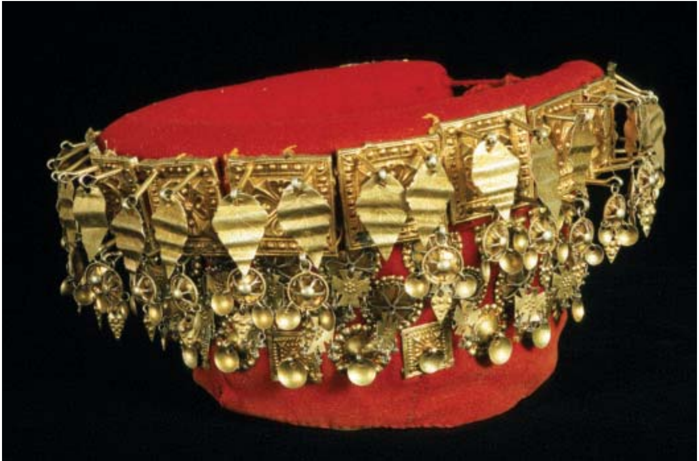
Brursølv, Jølster. Avstiva underlag, valk etter øvrekanter. Kledd med raudt firskaff ullty. Langs øvrekanter 14 støler med fire spyd i kvar støle. To rombelauv i den øvre, to filigransroser i den nedre spydrada. Tre rader med mindre sølv, støler med skållauv, borespenn med skållauv og krosslauv (Jølster nr. 78a. NF Lysbilette 13567).